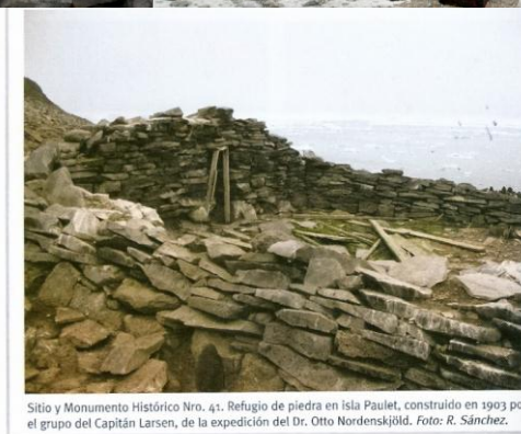
Sitio y Monumento Histórico Nro. 41. Refugio de piedra en isla Paulet, construido en 1903 por el grupo del Capitán Larsen, de la expedición del Dr. Otto Nordenskjöld.