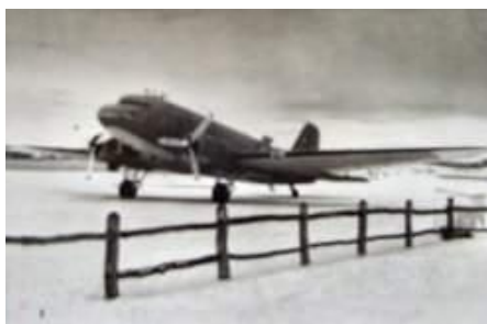
Foto en la pista del Aerop. Ushuaia

El DC3 fue el primer avión de la historia equipado con piloto automático. Comprados usados y reacondicionados en USA, fueron traídos en vuelo entre los años 1946/1948.