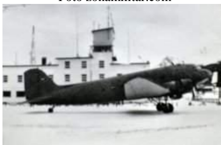
Foto frente a torre de control Aerop. Ushuaia